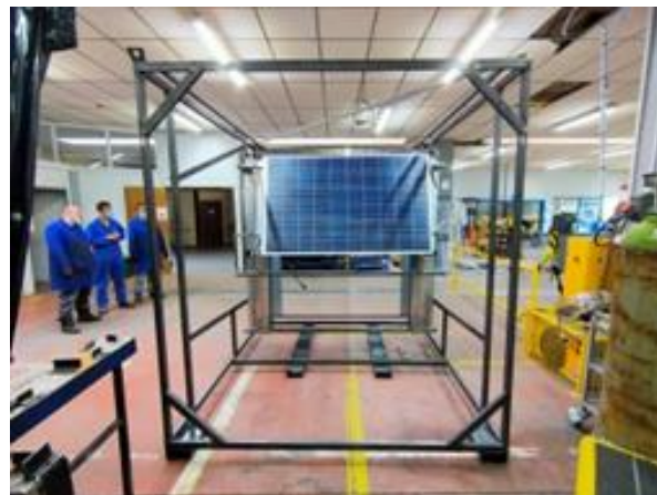
Panier de transport ESAT FRUGES